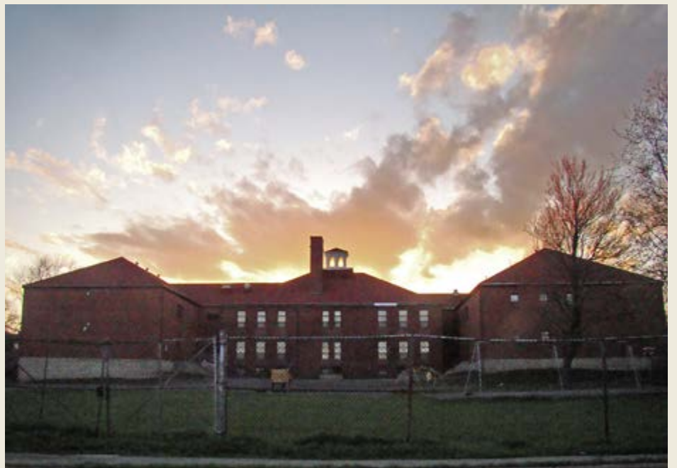
L'école Temperance

sur les espèces en péril du Canada en 2009. Nous ne connaissons pas parfaitement les causes de ce déclin, mais la perte d'habitat, les phénomènes météorologiques violents et la baisse du nombre