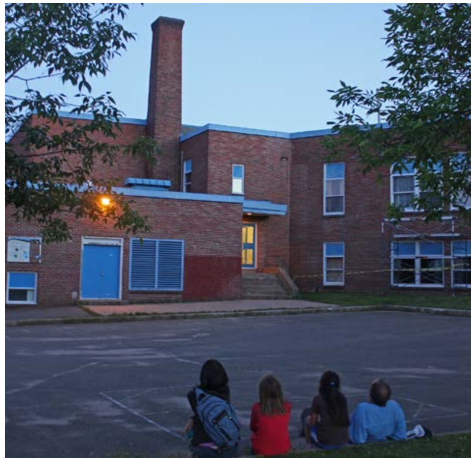
Middleton High School